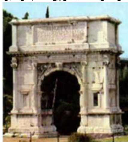
ارک تیتوس، جشن پیروزی رومی ها بر اورشلیم

پس از آن دوره شصت و دو «هفته»، آن رهبر برگزیده کشته خواهد شد، ولی نه برای خودش. سپس پادشاهی همراه سپاهیانش به اورشلیم و خانه خدا حمله برده، آنها را خراب خواهد کرد. آخر زمان مانند طوفان فرا خواهد رسید و جنگ و خرابیها را که مقرر شده، با خود خواهد آورد. دانیال 9:26 (539 قبل از میلاد)