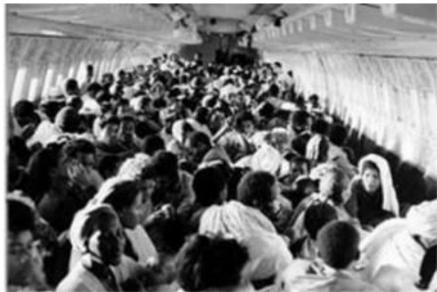
برگشتن یهودی ها از اتیوپی و جمع شدن آنها اشعیا 11:11

بر طبق کتاب حزقیال بعد از یک دوره طولانی، در " آخرین روزها " مردم اسرائیل به سرزمین شان پس از یک دوره جدائی طولانی بر می گردند. این مردم از یک ملت جدید که ملیتهای متفاوت دارند و مردمی با فرهنگهای متفاوت هستند، تشکیل می گردند. این مردم با صلح و آرامش در شهر بنون حصار زندگی خواهند کرد. این تشریح در حال حاضر تنها شامل مردم اسرائیل می گردد. ملت یهود پس از 2000 سال